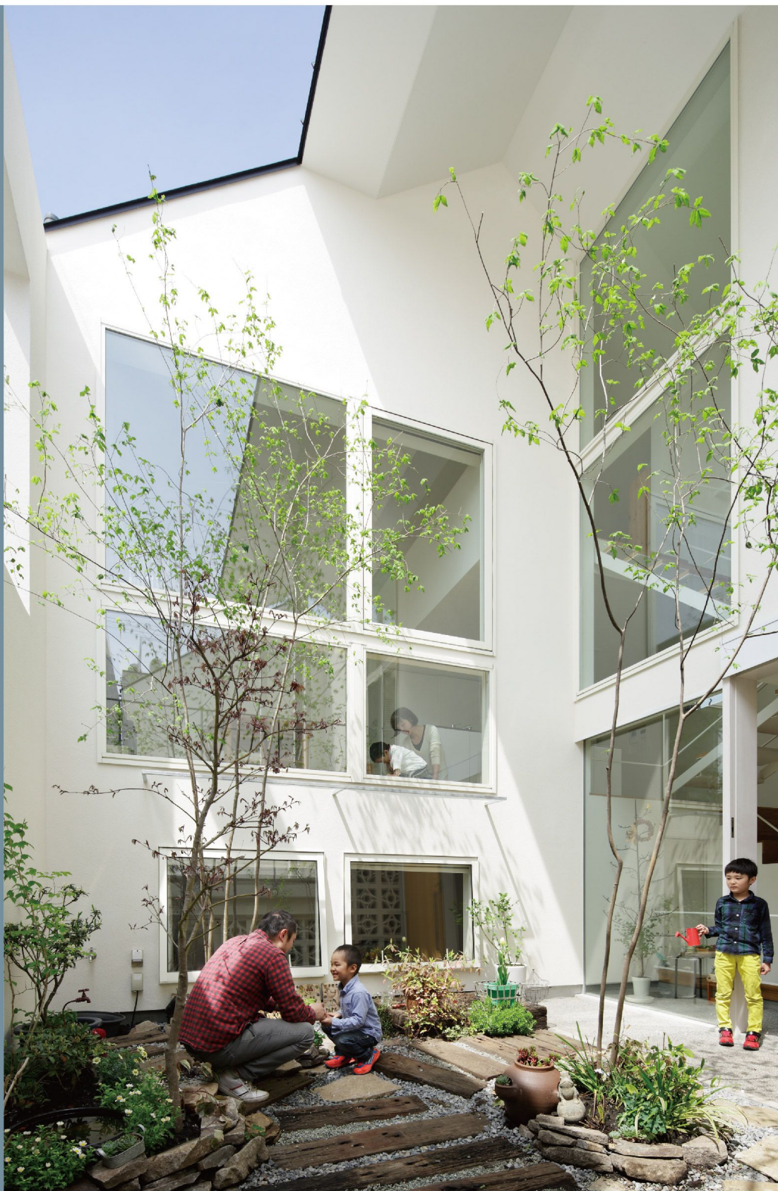
[prismlayer] 設計:河内真菜

5/11 (土) 10:30~17:30 ・ 12 (日) 10:00~17:00 (入場無料)