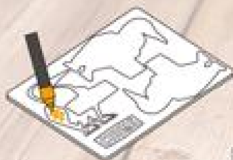
1. 間伐材に色を塗って